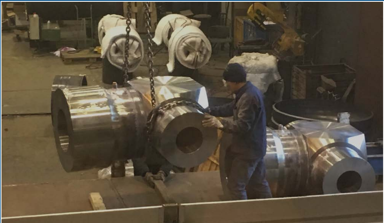
Spedizione - Delivering

RT examination by linear accelerator on weld over 200 mm thick